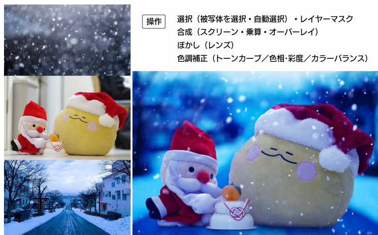
図 1 Photoshop を用いた画像合成

百聞は一見に如かずといえますので、一つ Photoshop による画像合成の例を示したいと思います（図 1）。自宅で撮影したぬいぐるみの写真から被写体のみを切り抜いて背景と合成し、色調補正やフィルタを加えています。